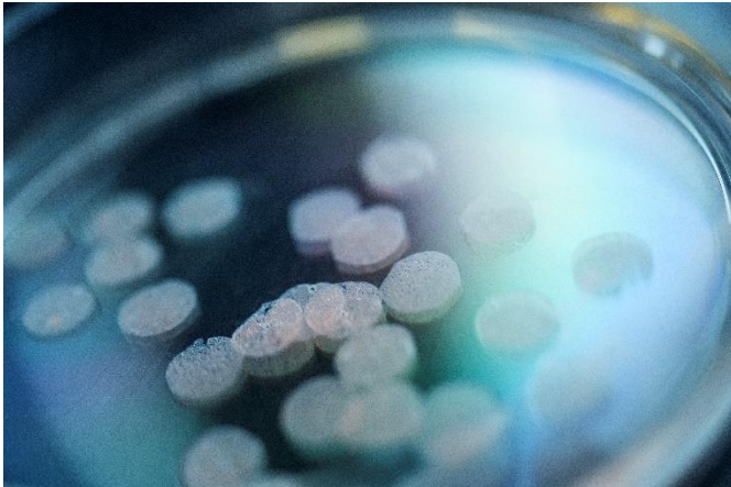
Abb. 1 Etwa 500 \mu\text{m} dünn sind die Lungen-gewebeschnitte, mit denen die Forscher Infektionen im menschlichen Gewebe untersuchen.